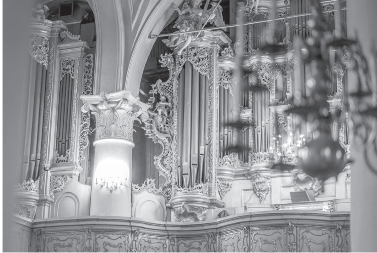
Sv. Trīsvienības baznīcas ērģeles ir pasaulē lielākās nepārbūvētās mehāniskās ērģeles

Pētertirgus nosaukumu ieguvis, pateicoties Kurzemes pēdējam hercogam Pēterim Bironam. Savā tagadējā vietā tas atrodas jau kopš 1910. gada un ir otrs lielākais tirgus Latvijā (aiz Rīgas Centrāltirgus). Te ir divas plašas āra nojumes ar vairāk kā 200 tirdzniecības vietām un liels, skaists paviljons, kura divos stāvos pieejams pārsteidzoši plašs preču sortiments. Turklāt tirgus darbojas katru dienu, un produktu cenas te ir zemākas nekā veikalos. Tiesa gan, pēdējo gadu laikā tirgotāju skaits samazinājies, un paviljonā ir visai daudz tukšu stendu, kas neliecina par labu vietējai ekonomikai.