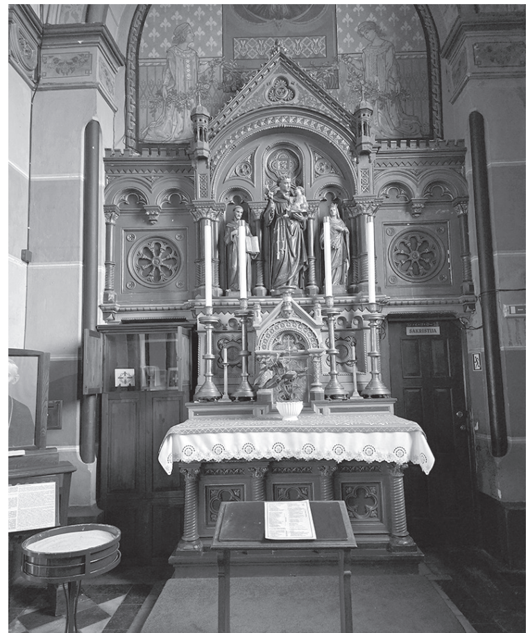
Sv. Jāzepa katedrāles interjerā ir daudz mākslas darbu, arī šis sānu altāris un kapela

Ērģelēm ir 131 reģistrs, 4 manuāļi un vairāk nekā 7000 stabuļu. Šī varenā instrumenta skanējumu var baudīt svētdienas dievkalpojumos vai Starptautiskā ērģelmūzikas festivāla laikā, kas notiek katru septembri.