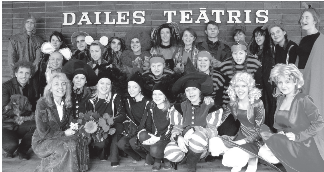
2010. gada aprīlī «Knifiņš» kā «Gada izrādes 2009» finālists iestudējumu «Smaragda pilsētas burvis» izrādīja uz Dailes teātra mazās skatuves