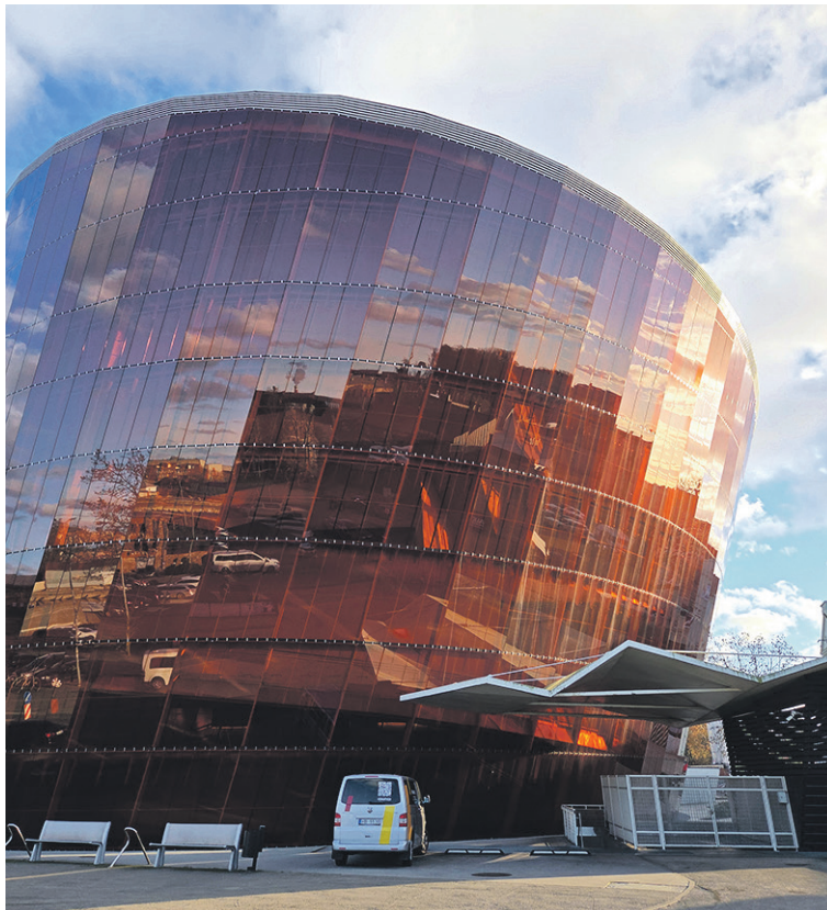
Koncertzāle «Lielais dzintars»

Pavisam netālu no promenādes slejas vēl viens Liepājas lepnums – koncertzāle «Lielais dzintars», novatoriskas konstrukcijas dārgakmenim līdzīga ēka, kuras ārējās nav neviena taisna leņķa, neviena identiska loga, bet tonētais stikla korpuss saules gaismā dzirksti gluži kā dzintars. Ēka piesaista skatu arī pēc tumsas iestāšanās, kad tā izgaismojas no iekšpuses. Savukārt interjera elementi pārsteidz ar daudzveidību – neapdarinātas betona sienas mijas ar īstiem šedevriem, piemēram, koncertzāli ar maināmām iekšējām konstrukcijām un pasaules līmenī unikāliem akustikas risinājumiem, kas ik nēcīgāko skaņu no skatuves vienmērīgi izplata visā plašajā telpā ar 1000 skatītāju vietām. Ne velti šis objekts 2016. gadā saņēmis Starptautisko arhitektūras