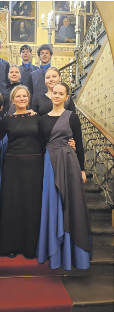
mnāzijas vokālajā ansambli, u konkursa «Balsis» finālā