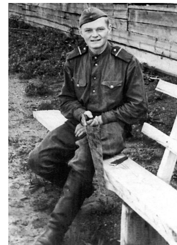
Alfons padomju armijā

– Lopu vagonos – gluži kā izsūtītos – mūs aizsūtīja uz Tālajiem Austrumiem. Braucām 24 diennaktis cauri visai Sibīrijai, lai nokļūtu gala punktā – Čitas apgabalā, pie Mongolijas robežas, – Olevjaņenskijas rajonā. Ceļš nebija viegls, bet tur bija kaut kas neredzēts – skaista daba! Mežu nebija, bet tikai stepes, stepes, kalni, lejas... Redzēju arī skaisto Baikāla ezeru. Un nekā cita – vien ik pa 100 kilometriem kāds burjats uzslējis savu jurtu stepes vidū. Viņi lopus ganīja gan ziemu, gan vasaru – visiem lopiņiem, arī govīm un zirgiem, bija gara, gara vilna. Saprotais, jo tur taču bija ļoti auksti – līdz pat -60°C. Arī mēs pieredzējām lielu aukstumu – izdzīvojām. Es tikai degunu apsaldēju, tas man vēl ilgi bija sarkans. Bet tur jau to salu tā nejut, jo klimats ir sauss... Kad tu jūti, ka sals ir iekniebis, tad tas jau ir nopietni. Atpakaļ no tālās Krievijas atgriezies 1957. gadā.