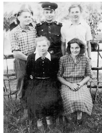
Spruktu ģimene. 20. gs. 50. gadi

vien seši mēneši, kad tēti paņēma prom no mājām. Mūsu ģimenei bija jaunsaimniecība – 17 ha, piecas slaucamas govīs, divi zirgi, cūkas, aitas, vistas un viss cits kā kārtīgā saimniecībā. Bet ko mamma varēja viena izdarīt ar četriem maziem bērniem?!... Es kā vecākais jau agrā bērnībā daudz dabūju strādāt, palīdzot mammai. Bija zeme jāapstrādā, lopi jākopj. Atceros, ka bija kaimiņu puika, kas bija par mani četrus gadus vecāks. Viņa